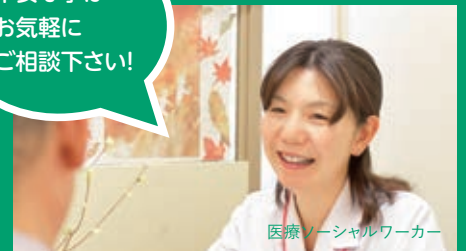
医療ソーシャルワーカー