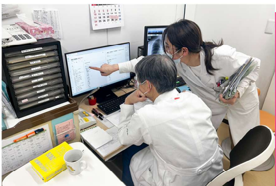
診察室での最終確認