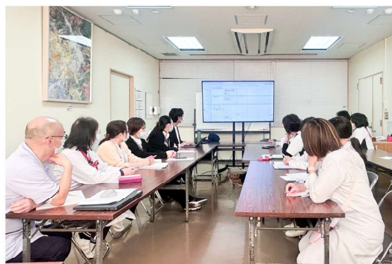
部署横断で確認・議論