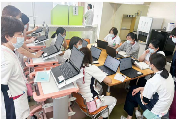
病棟での操作研修