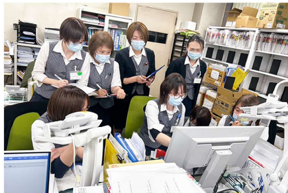
医事課でのシミュレーション